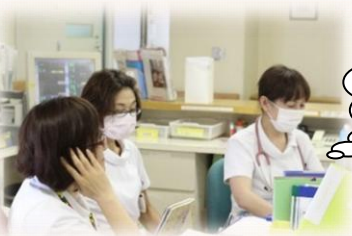
呼吸器科の頼もしいベテランナース

呼吸器科は、重症肺炎、COPD、肺がんの患者が主で、急性期にはNPPVによる治療も行っています。また、がん化学療法認定看護師を中心に、抗がん剤治療の看護や患者・家族の希望を考えた看護が行えるよう日々頑張っています。