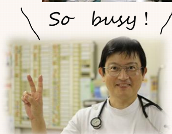
So busy! /