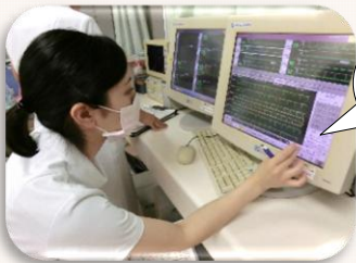
モニターは24時間観察します。