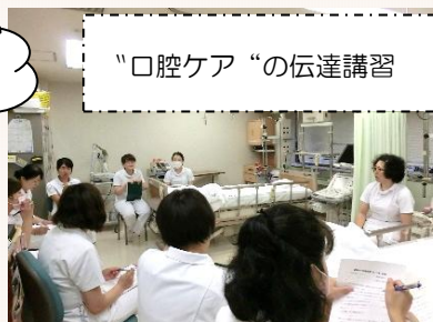
「口腔ケア」の伝達講習