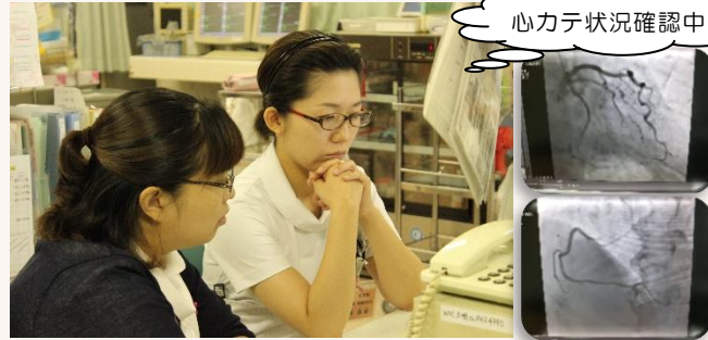
心カテ状況確認中

循環器科は、HCUで救命治療を受けた心筋梗塞や心不全の患者、カテーテルによる検査や治療を予定している患者、ペースメーカーを必要とする患者が主で、再発予防のための生活習慣における指導にも力を入れています。